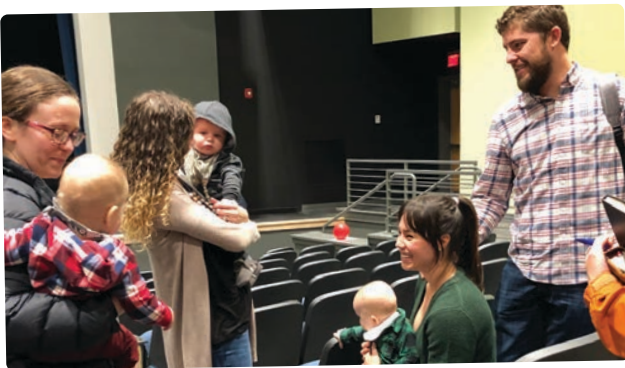
Miembros de LifePath conversan después de un servicio en el auditorio de una escuela local.