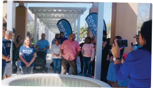
Miembros de la iglesia HEC Zion se reúnen para un bautismo al aire libre en febrero de 2020.

distribuido para la multiplicación de iglesias