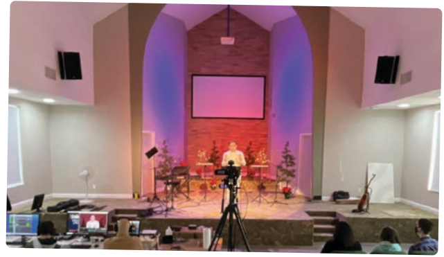
Steve y el equipo de GracePoint transmiten en vivo un servicio desde el edificio que compraron en 2020.